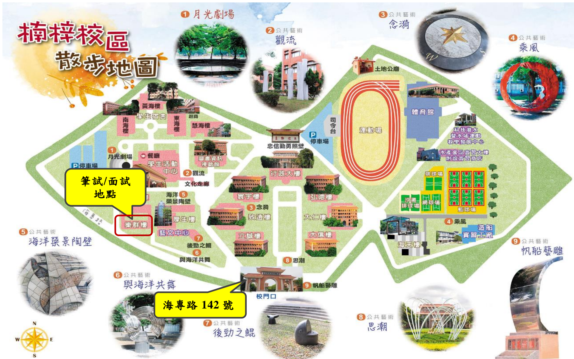
國立高雄科技大學楠梓校區平面圖